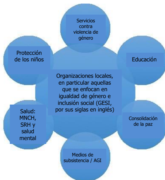
Figura 2: Agregar a los actores locales con apoyo específico

La Tabla 2 describe las consideraciones prácticas de la programación de efectivo+ y de recuperación temprana. La Figura 2 muestra visualmente cómo los actores locales pueden suministrar el núcleo, reforzado con servicios dirigidos específicos prestados por los actores locales y basados en las necesidades identificadas por las organizaciones locales conforme se susciten.