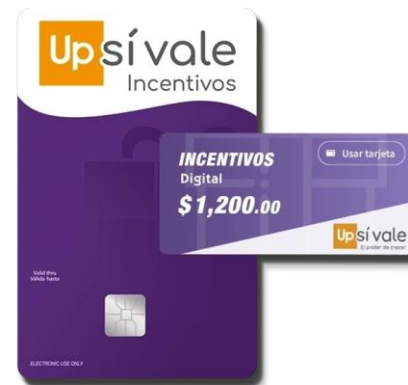
UP INCENTIVOS Y OFICINA EN CASA