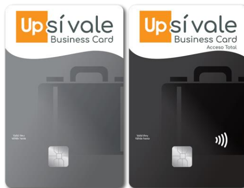
UP BUSINESS CARD